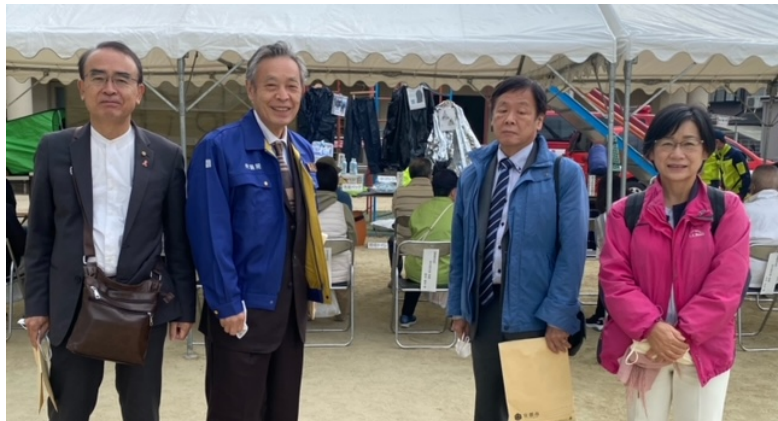
右から、玉本なるみ市議、浜田よしゆき府会議員、こくた恵二衆議院議員、井坂博文市会議員

年に1回でも、防災についての学び、訓練など経験しておくことはとても大事だと思います。