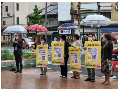
河原町三条で宣伝も行いました。

日本共産党は「痴漢ゼロ」に取り組んでいます。おそらく泣き寝入りをしている方が多いのではないのでしょうか？しかも、大学受験に向かう女子高生が狙いどころというネットでの書き込みがあり、問題になりました。そこで、今、日本共産党京都府委員会は「痴漢被害調査」を実施しています。ぜひご協力ください。おどろくばかりの痴漢被害にあった経験が、寄せられており、これは放っておくわけにはいかないと痛感しています。見せられて嫌な気分になったという方は多くおられます。そして、やっぱり忘れないのでは無いでしょうか？「痴漢は犯罪です」魔が差したでは済まされたいと思います。もっと社会的に対策をしていく必要があります。たけやまさん