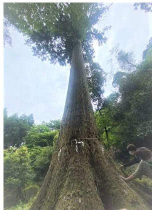
戦火を逃れた樹齢400年の北山大杉