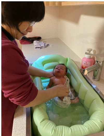
久々に沐浴しました。とにかく小さくて、可愛いです！

子育て世代を身近にみていると、応援してやりたいし、社会自体が、もっと子育てに優しい施策を作り、応援しないと、安心して子育てできないと思います。京都市以外の京都府内の自治体は、子どもの医療費助成はほとんどが中学校まで月200円になっていきます。京都市は京都府と強調して拡充するとしていますが、なかなか拡充されません。すべての子どもの命を守るために、頑張らなくては！