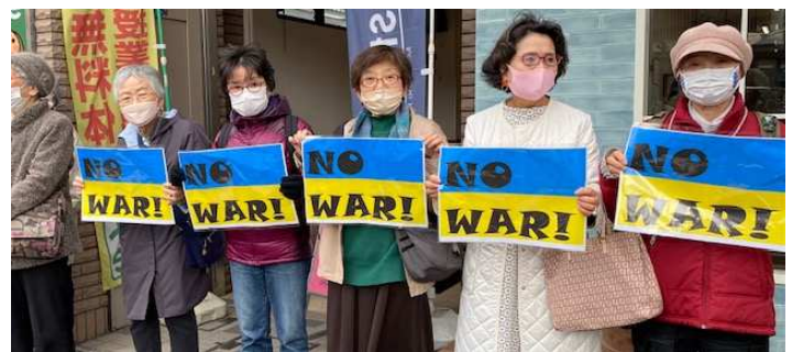
5人の方に同じプラカードを持ってもらいました。目立ちますよね！

つぶやき：NO WAR! 「戦争はダメ！」と叫ばずにはおられない。ロシアによるウクライナの侵略に心痛めている方が多いと思います。ウクライナの国旗の色（ブルーと黄色の2色）に「NO WAR!」と書いて、アピールしています。