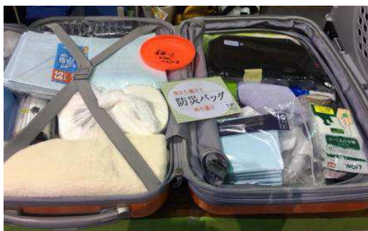
上写真：ペット用防災グッズ

と。我が家にももうすぐ16歳の老犬がいるけど、今から訓練は難しいですね～。当然、人間の防災グッズも必要です。しかし、ペットを飼うというのはここまで責任を持たないといけないということです。