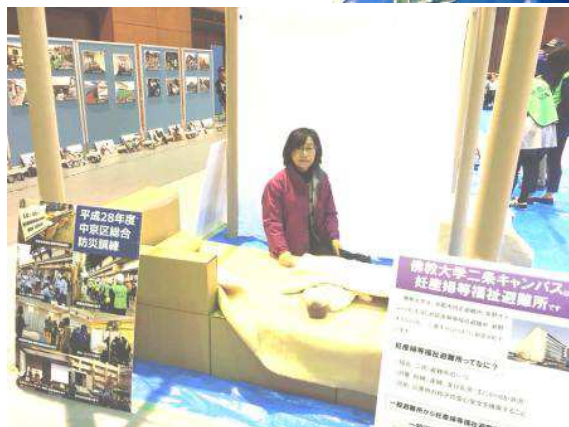
左写真、 段ボール紙で作られたベッド 。妊婦さんや赤ちゃんの福祉避難所のスペースとして、熊本地震の際に実際に使われていたとのことでした。