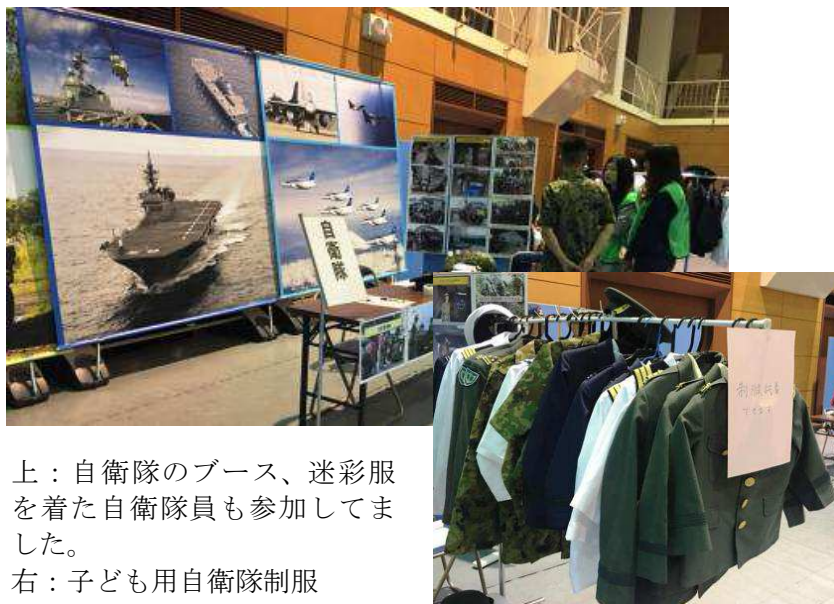
上：自衛隊のブース、迷彩服を着た自衛隊員も参加していました。

つぶやき：自衛隊宣伝・・・？ 北区の防災訓練で、驚いたのは、自衛隊のブースがあり、災害救助の写真もありましたが、戦車やジェット機、航空母艦など写真の方が大きいパネルで掲示され、子ども用の制服体験もあり、ギョッとしました。幸い子どもの参加はほとんどなく、制服体験をした子どもは私が参加している間は、なかったと思います。行政に対して、防災に関係ない展示のあり方について意見をしておきました。